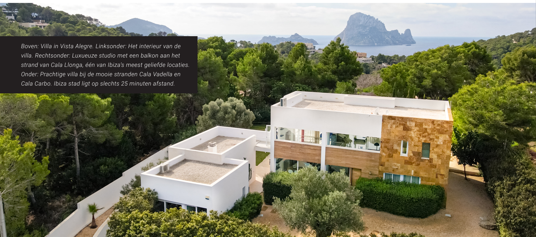
Boven: Villa in Vista Alegre. Linksonder: Het interieur van de villa. Rechts onder: Luxeuzes studio met een balkon aan het strand van Cala Llonga, één van Ibiza's meest geliefde locaties. Onder: Prachtige villa bij de mooie stranden Cala Vadella en Cala Carbo. Ibiza stad ligt op slechts 25 minuten afstand.