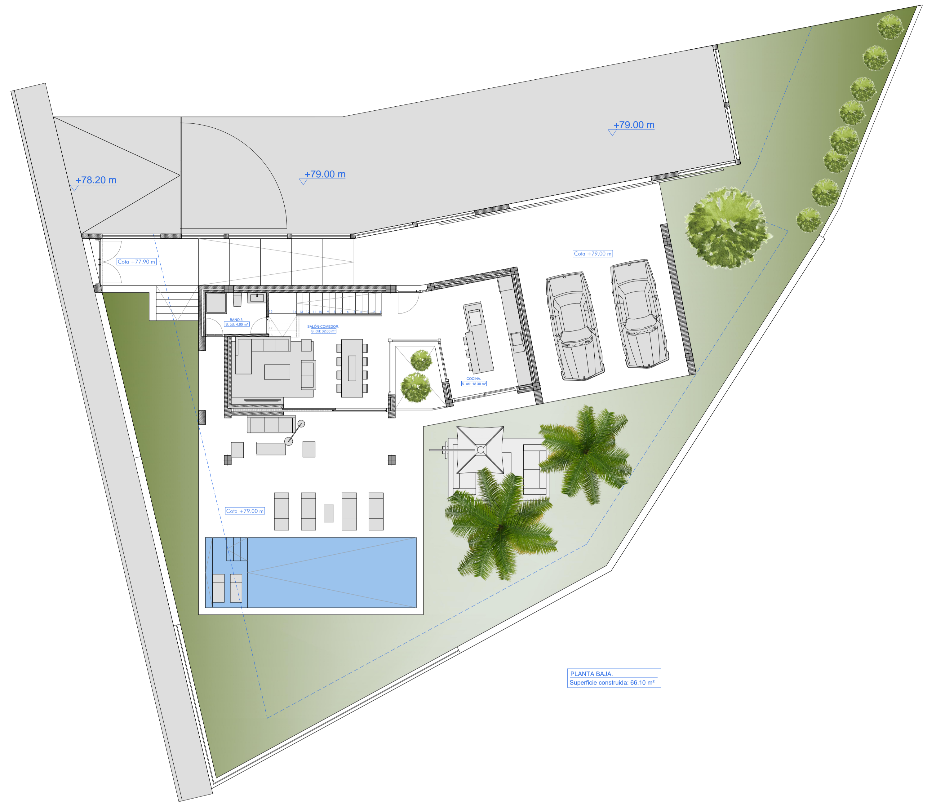
PLANTA BAJA. Superficie construida: 66.10 m 2