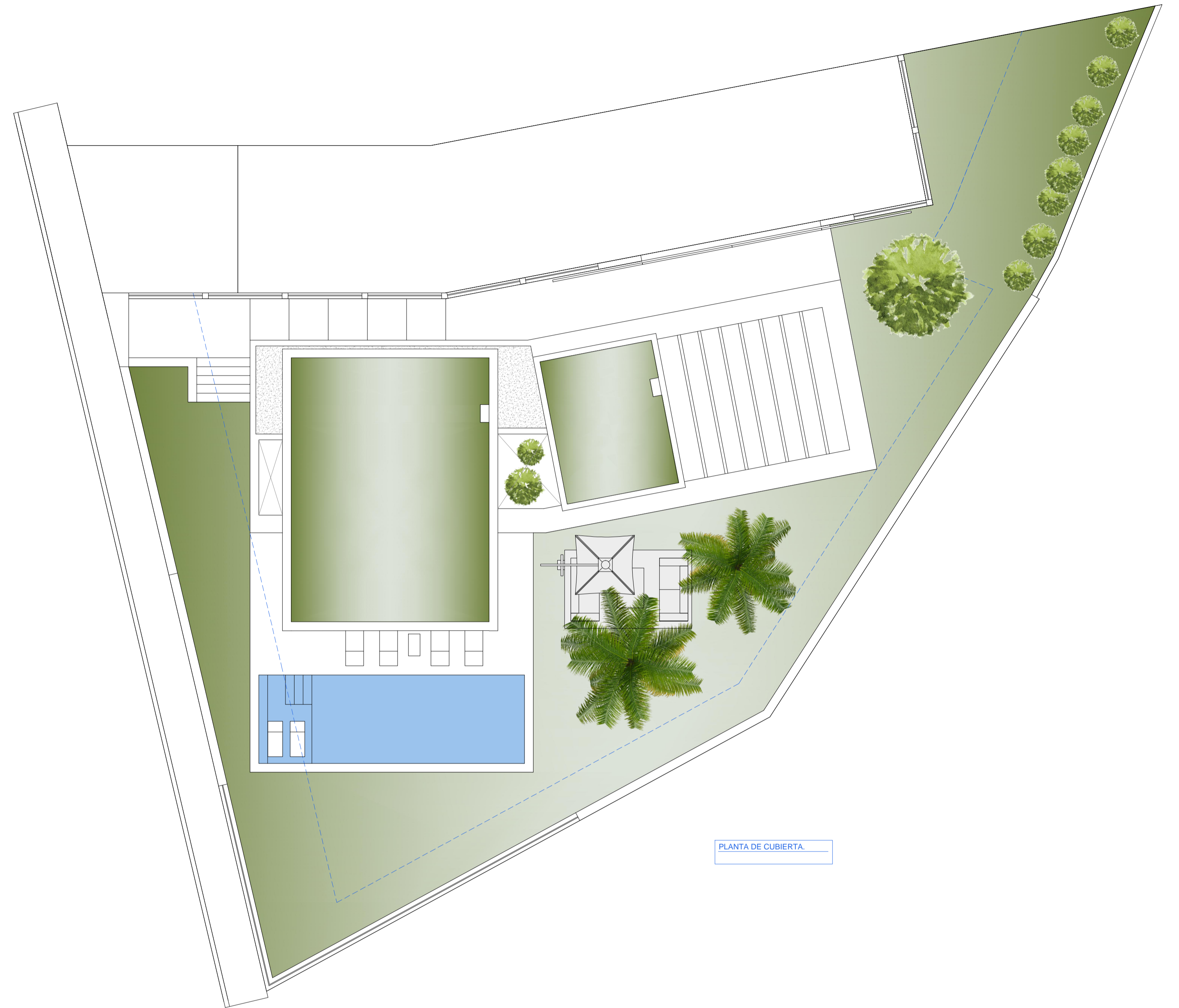
PLANTA DE CUBIERTA.