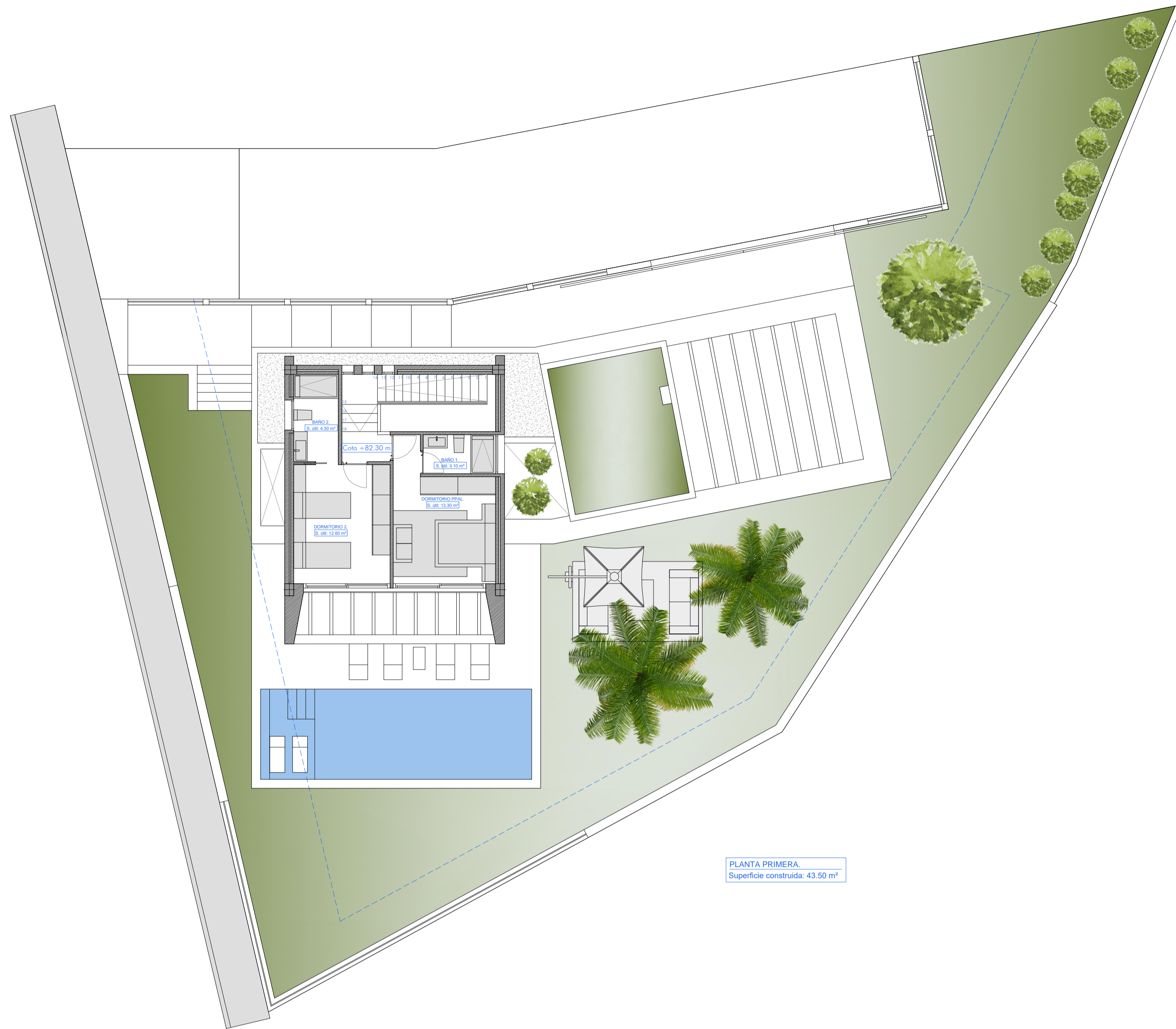
PLANTA PRIMERA. Superficie construida: 43.50 m 2