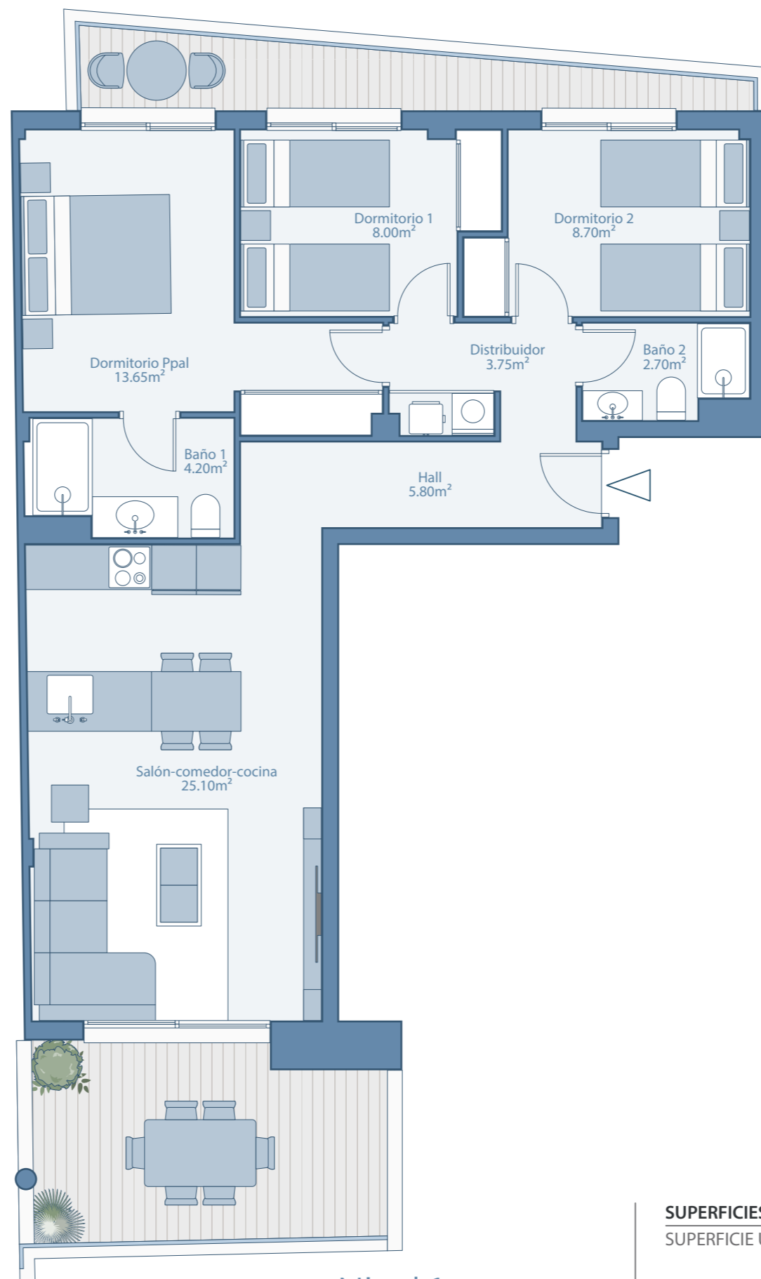
Nivel 1 Escalera 1 - A