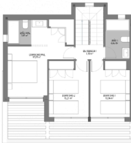
PLANTA ALTA 1:25