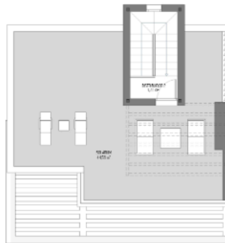
PLANTA SOLARUM 1:25