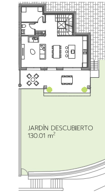
PLANTA DE JARDÍN