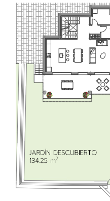
PLANTA DE JARDÍN