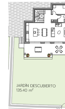
PLANTA DE JARDÍN